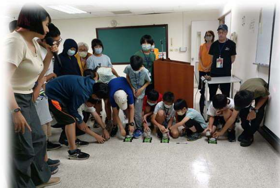
▲科學觀察專注力培養